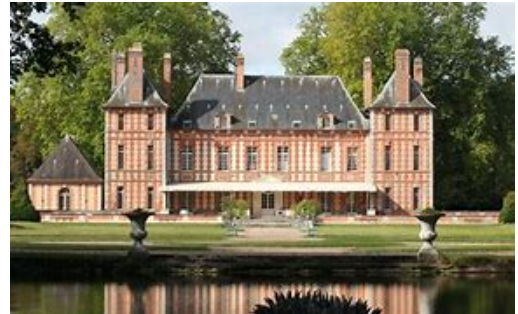
Vue du château de l'Étendue avant 1794..

La Mission Stéphane Bern et la Fondation du patrimoine ont annoncé, en 2019, que le château de l'Étendue allait être rénové. Une excellente nouvelle pour le château de l'Étendue, pour les bénévoles de l'association Passion patrimoine qui l'a défriché et pour la Ville.