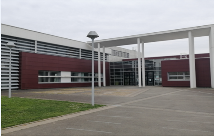
Collège Jean Rostand Les Herbiers

Nous avons interviewé cinq professeurs de différentes matières qui ont bien voulu répondre à nos questions, concernant leur métier et leur travail personnel.