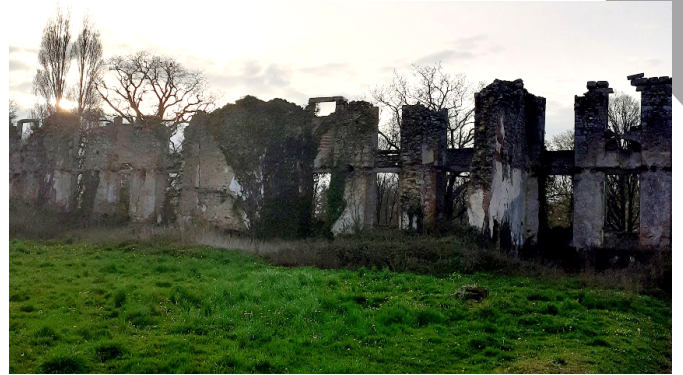
Photographie prise en 2022.

Une association Passion Patrimoine défriche et nettoie les lieux. Le projet et travaux ont été dans un premier temps des travaux d'urgence de cristallisation du château comprenant travaux préparatoires, échafaudages, reprise de maçonnerie, reprise des arases, traitement des fissures et enduits.