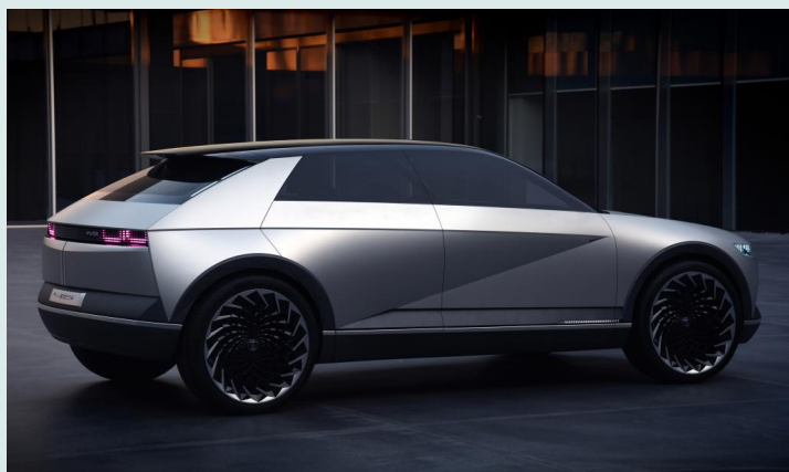
IONIQ 5, HYUNDAI

NOUS AVONS INTERVIEWÉ PLUSIEURS CONCESSIONNAIRES SITUÉS À CHOLET POUR QU'ILS RÉPONDENT À NOS QUESTIONS SUR LES VOITURES ÉLECTRIQUES.